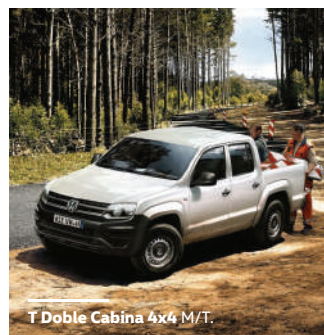
T Doble Cabina 4x4 M/T.